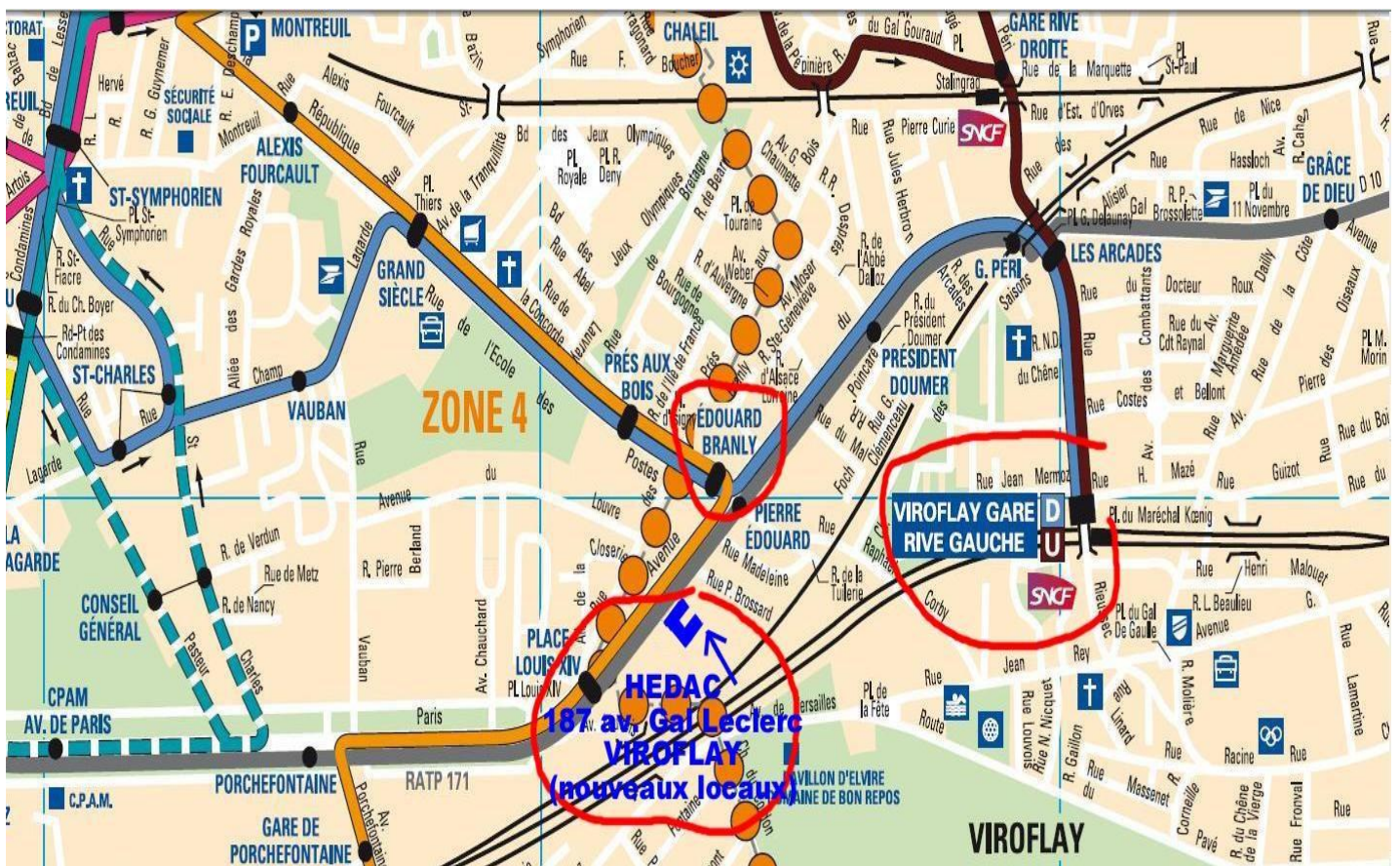
PLAN depuis la gare de Viroflay rive gauche avec Phébus Ligne D (en bleu)